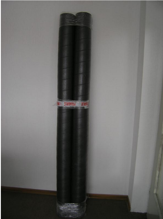
2 x PE-Rohr (á 2 m)